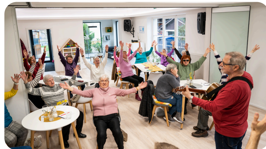
veselé procvičování paměti