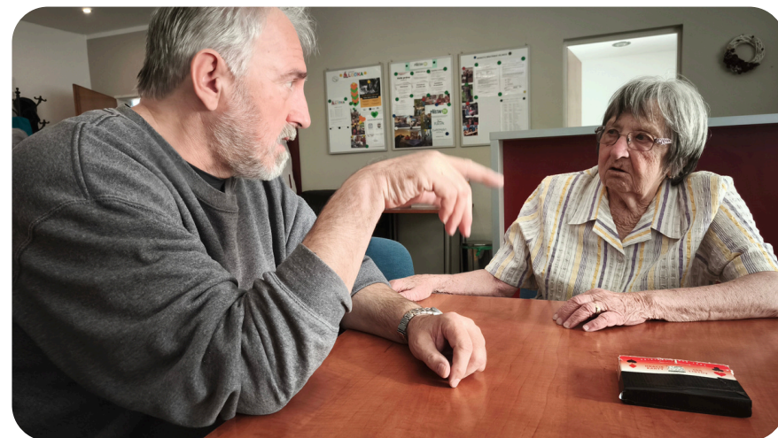
rozhovor v klubu seniorů

Vloni jsme podnikli několik výletů, např. do osady Jizerka, kde jsme navštívili Muzeum Jizerských hor, do sousedního lázeňského městečka Lázní Libverdy, společně s libverdskými klienty jsme zavítali do Nového Města pod Smrkem k pramenu Novoměstské kyselky.