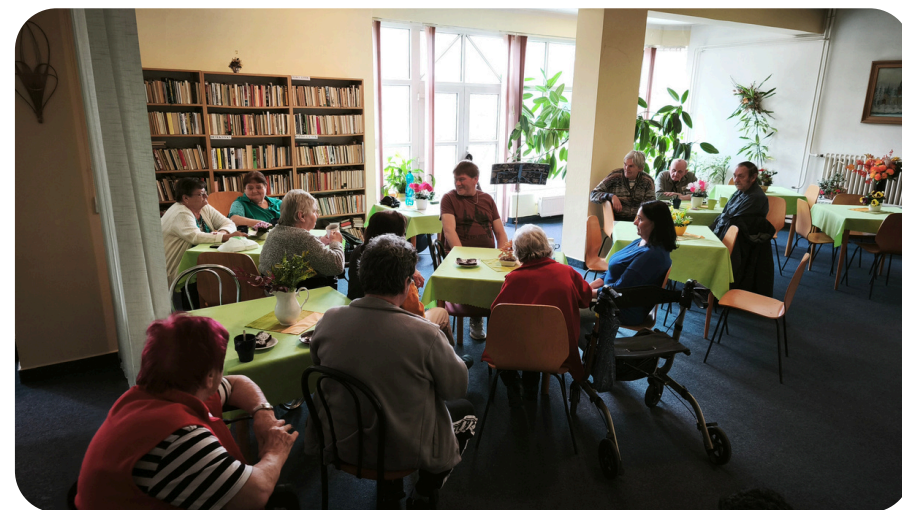
zpívání v domově seniorů

Zároveň probíhalo průběžně jednání s pracovníky sociálního odboru a vedením města Semily o možnosti podpory a zařazení semilského střediska Přístavu 3V do krajské sítě sociálních služeb. Toto jednání ale nebylo úspěšné, a i když naši práci v zásadě oceňují, tak k zasíťování v dohledné době nedojde. Hledáme tudíž jiné formy finančního pokrytí.